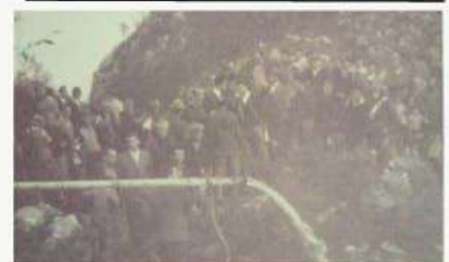
Cerimonia di inaugurazione sul Colle 1958

Corso annuale di Costruzione Muretti a secco 2023 da martedì 5 a sabato 9 settembre