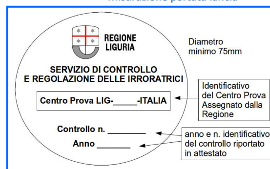
Esempio di etichetta adesiva

Una volta superato il controllo funzionale il Centro Prova rilascia: