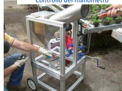
Misurazione portata lancia